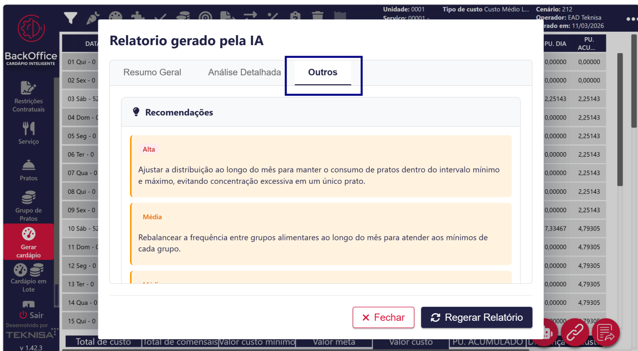
Figura 5: Outros