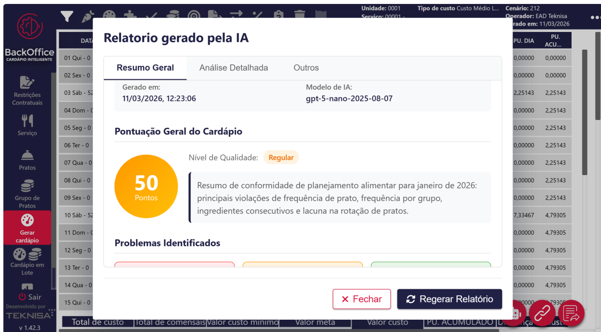
Figura 2: Relatório de IA