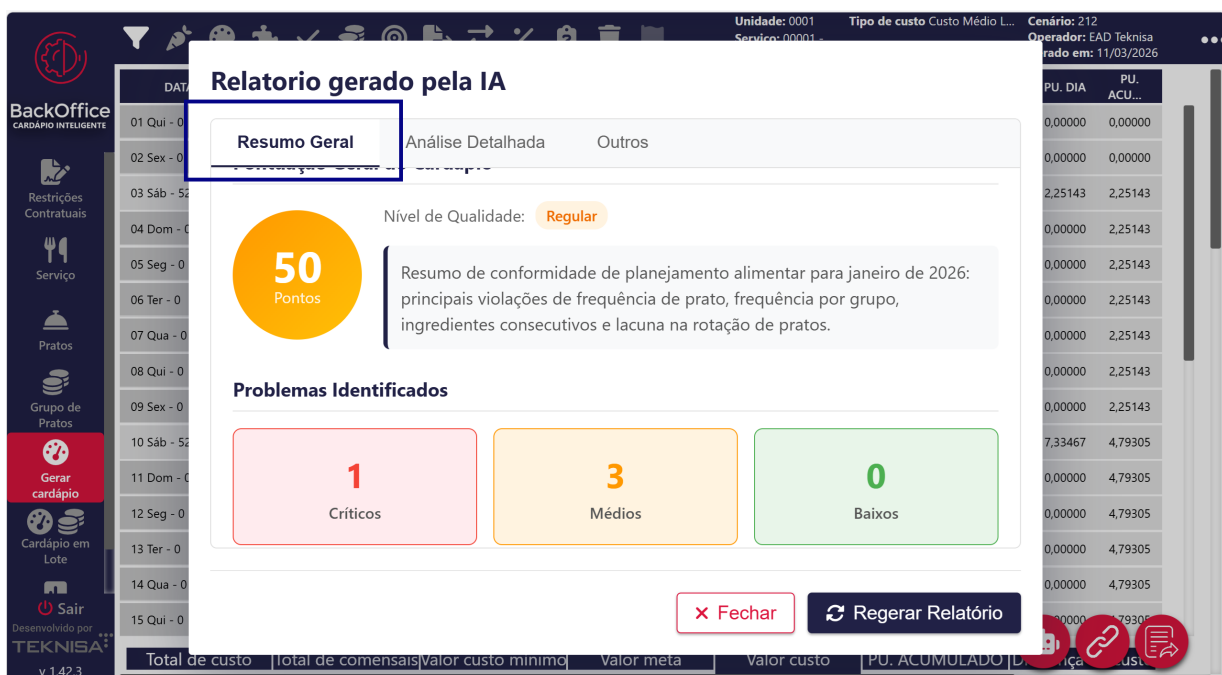
Figura 3: Relatório de IA: Resumo Geral